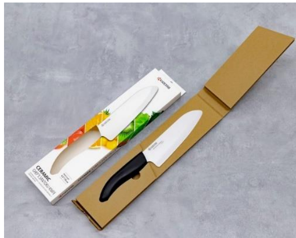
Kyoceras neue Verpackungsmaterialien – Einlage