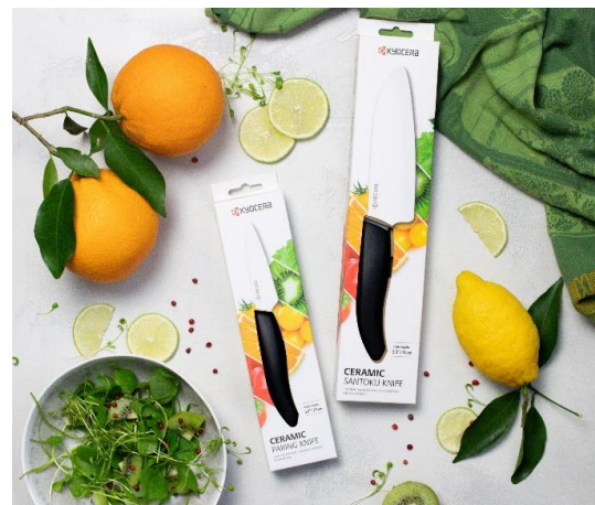
Kyoceras neue Verpackungsmaterialien – Außenverpackung